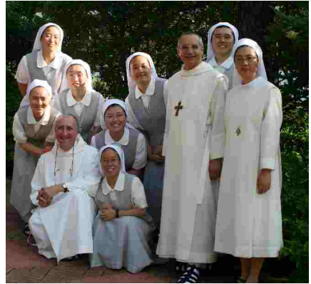
Deux maylisiens avec quelques postulantes coréennes.

Ainsi commence notre séjour qui sera un éblouissant accueil fraternel et une suite de délicatesses. Nous aurons toujours la sécurité d'un accompagnement de frères, de sœurs, ou d'oblates, et malgré notre ignorance du coréen, nos quelques mots d'anglais ou d'italien, nous communiquerons de cœur à cœur.