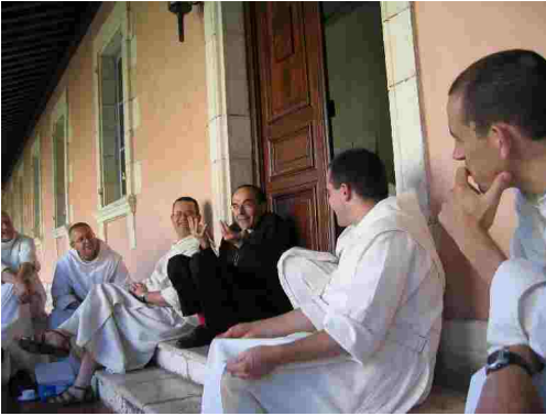
Récréation avec le cardinal Barbarin.