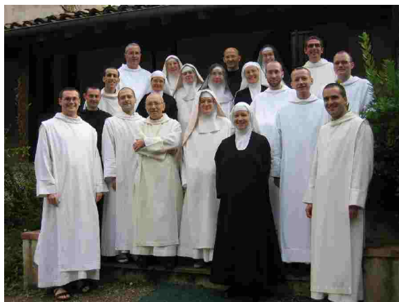
Rencontre des jeunes moines et moniales.

Quelle joie de pouvoir tout simplement partager à nos frères et sœurs olivétains comment s'est édifiée au fil du temps notre petite famille de Maylis. Une construction qui s'est faite lentement, avec peine souvent, mais aussi avec de grandes joies. Pour nous, les jeunes moines de l'abbaye de Maylis, quel bonheur de pouvoir ainsi mieux connaître et faire nôtre tout cet héritage !