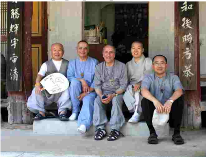
Un bonze, une bonzesse, et trois moines chrétiens.

Nous avons eu l'occasion de monter dans les environs de Séoul, à l'Observatoire, lieu symbolique de la déchirure géographique et politique coréenne. D'un côté du fleuve Amnok-Kang qui sépare la partie Nord de la partie Sud, nous avons pu à travers des jumelles apercevoir les petits hameaux « retapés » par le régime et son idéologie pour ne pas dénoter devant le tourisme international. Nous avons bien senti que la déchirure existe encore dans le cœur de beaucoup de Coréens et demeure un point sensible. La présence américaine nous a paru très discrète... à peine un ou deux soldats montant la garde dans une guérite, le long du fleuve. Pour les familles, les possibilités d'entrevues entre les membres